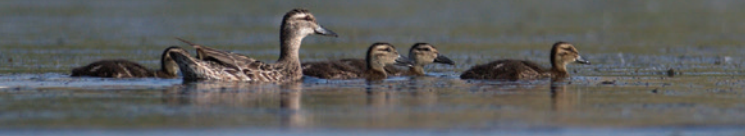
Kačica chrapačka s mláďatami